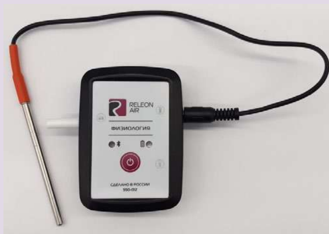
Рис. 12. Датчик температуры тела

Датчик температуры тела — предназначен для непрерывного измерения температуры тела в подмышечной впадине. Оснащён выносным зондом. Диапазон измерения: от 25 до 50 °С. Разрешение датчика: 0,1 °С. Технологическая особенность: для точного измерения в подмышечной впадине должна находиться вся металлическая часть зонда.