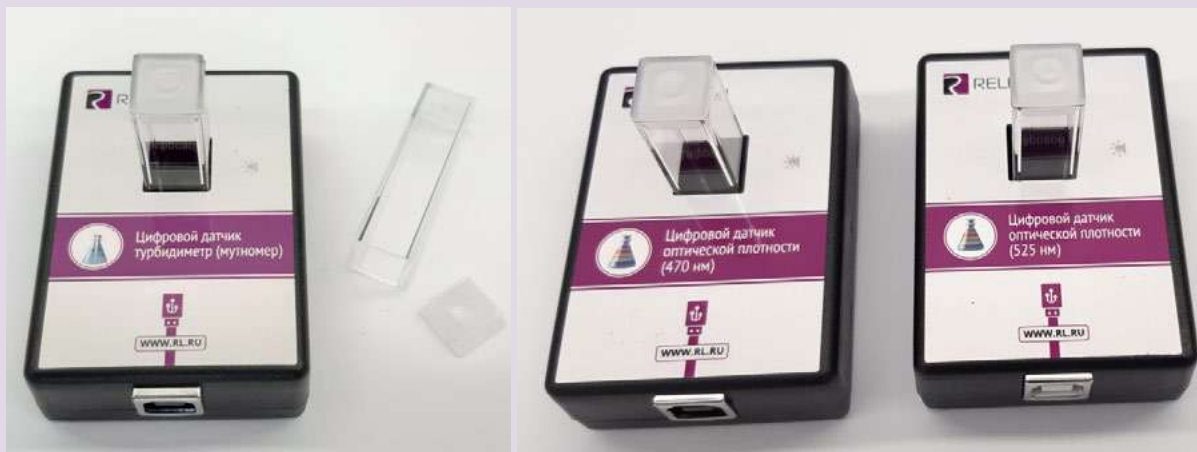
Рис. 8. Датчики мутности (слева), оптической плотности на 465 нм (в центре) и 525 нм (справа)

В комплект входят датчики с различной длиной волн полупроводниковых источников света: 465 и 525 нм. Диапазон измерения коэффициента пропускания света: от 0 до 100 %. Разрешение при измерении коэффициента пропускания: 0,1 %. Диапазон измерения оптической плотности: от 0 до 2 D. Разрешение при измерении оптической плотности: 0,01 D. Длина оптического пути кюветы: 10 мм. Объём кюветы: 4 мл. Технологические особенности: требуется хорошо промывать кювету для исследуемого раствора.