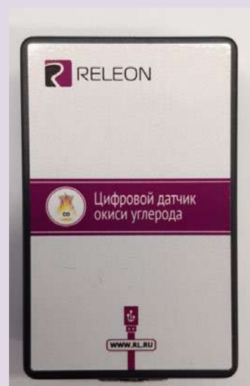
Рис. 11. Датчики кислорода (слева) и угарного газа (справа)