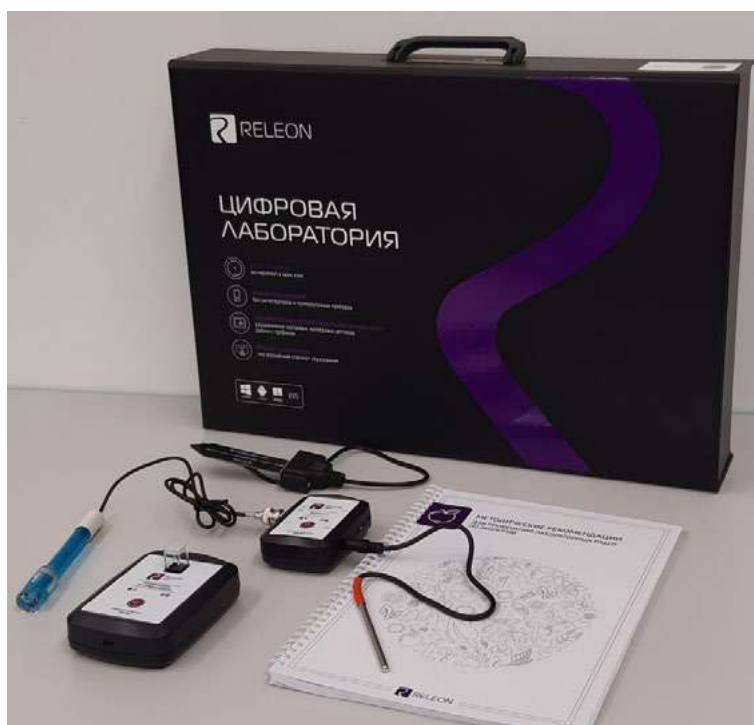
Рис. 1. Цифровая лаборатория

Ниже дана краткая характеристика цифровых датчиков, приведены выявленные на практике технологические особенности применения. Учёт этих особенностей позволит правильно использовать датчики и продлить срок их службы.