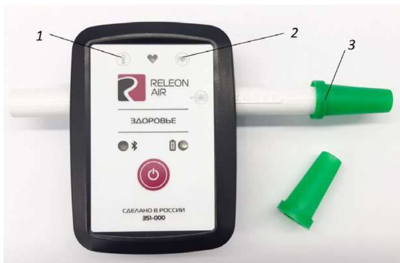
Рис. 3. Мультидатчик по физиологии. Обозначение разъёмов и технологических отверстий: 1 — температура тела, 2 — пульс, 3 — частота дыхания (надет съёмный мундштук)

Мультидатчик по физиологии позволяет определять артериальное давление, пульс, температуру тела, частоту дыхания, ускорение движения (рис 3).