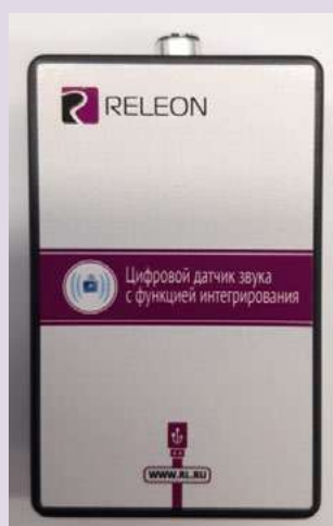
Рис. 7. Датчик звука

Датчик звука — измеряет уровень шумов в окружающей среде и при оценке шумопоглощающих изоляторов. Динамический диапазон: от 30 до 130 дБ. Частотный диапазон: от 50 Гц до 8 кГц. Разрешение: 0,1 дБА (акустические децибелы). Технологические особенности: датчик чувствителен к резким звукам, которые могут дать завышенные результаты измерений.