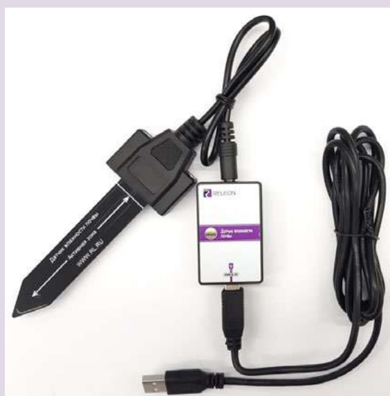
Рис. 4. Датчик влажности почвы

Датчик влажности почвы — предназначен для измерения степени увлажнения почвы, выраженной в процентах. Применяется в агроэкологических и сельскохозяйственных исследованиях.