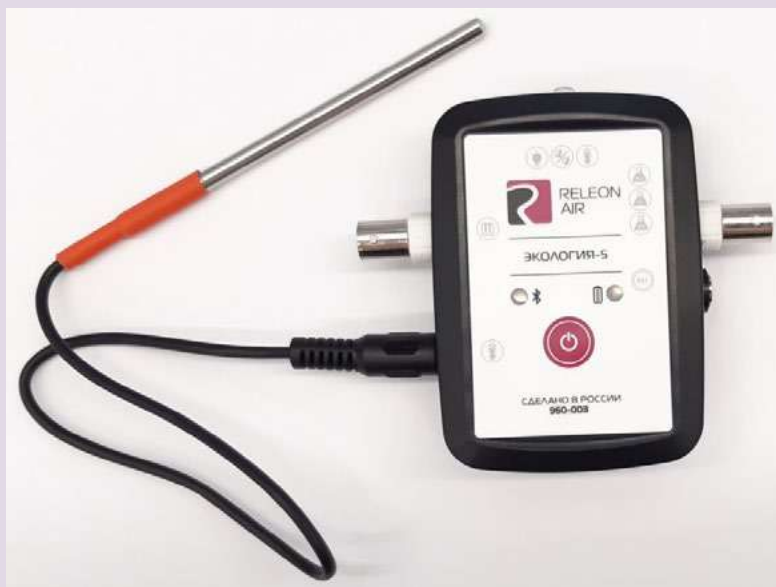
Рис. 6. Датчик температуры растворов

Датчик температуры термопарный предназначен для измерения температур до 900. Используется при выполнении работ, связанных с измерением температур плавления и разложения веществ, а также для измерения температуры в экзотермических процессах.