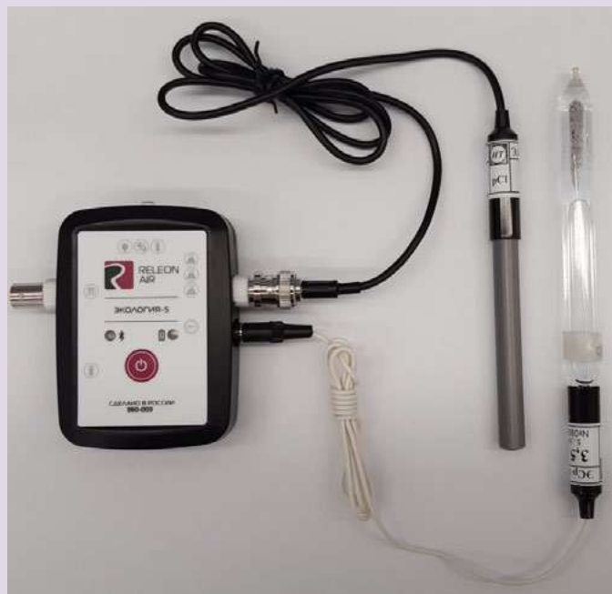
Рис. 10. Ионоселективный датчик (присоединены электро хлорид-ионов и электрод сравнения)

Датчик кислорода — предназначен для определения относительной концентрации кислорода в воздухе. Диапазон измерения: от 0 до 100 %. Разрешение: 0,1 %. Технологические особенности: при измерении содержания газа в выдыхаемом воздухе необходимо держать мембрану максимально близко ко рту; восстановление показаний на воздухе происходит через 1—2 минуты (время диффузии через мембрану).