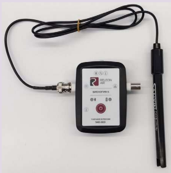
Рис. 5. Датчики электропроводимости

Датчик электропроводимости — предназначен для регистрации и измерения удельной электропроводности жидких сред, в том числе и водных растворов веществ. Применяется при изучении характеристик водных растворов, в том числе почвенных вытяжек.