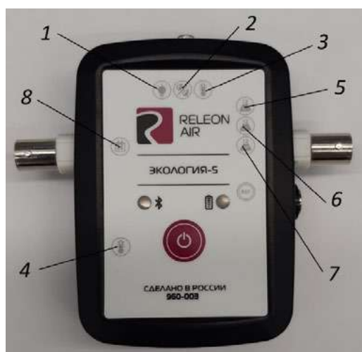
Рис. 2. Мультидатчик по экологии. Обозначение разъёмов и технологических отверстий: 1 — освещённость, 2 — относительная влажность воздуха, 3 — температура окружающей среды, 4 — температура растворов, 5 — нитрат-ионы, 6 — хлорид-ионы, 7 — pH, 8 — электропроводность

Мультидатчик по экологии позволяет измерять следующие показатели: водородный показатель водных сред, концентрации нитрат-ионов и хлорид-ионов, электропроводность, влажность, освещённость, температуру окружающей среды, температуру растворов, растворов и твёрдых тел (рис. 2).