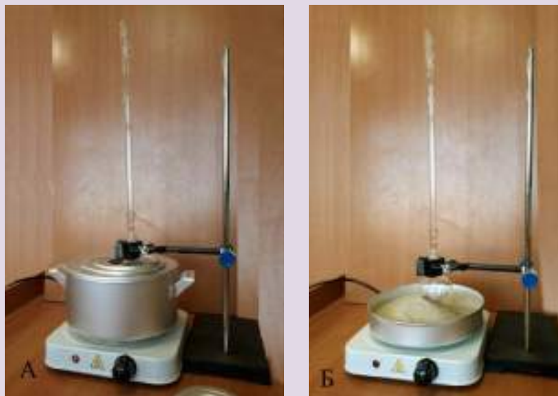
Рис. 6. Баня комбинированная лабораторная. А — водяная баня. Б — песчаная баня

Баня комбинированная предназначена для нагрева стеклянных и фарфоровых сосудов, когда требуется создать вокруг нагреваемого сосуда равномерное температурное поле, избежать использования открытого пламени и раскалённой электрической спирали (рис. 7). Корпус комбинированной бани сделан из алюминия. Жидкостная часть комбинированной бани закрывается кольцами различного диаметра.