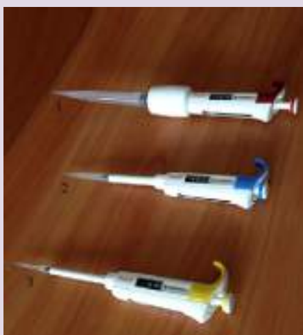
Рис. 5. Пипетки дозаторы одноканальные переменного объёма: 1 — 110 мл; 2 — 100—1000 мкл; 3 — 10—100 мкл.

Пипетка-дозатор — приспособление, используемое в лаборатории для отмеривания определённого объёма жидкости. Пипетки выпускаются переменного и постоянного объёма. В комплекты оборудования для медицинских классов входят удобные пипетки-дозаторы одноканальные, позволяющие настроить необходимый объём отбираемой жидкости в трёх различных диапазонах (рис. 6). Использование современных технологий и цветовой кодировки диапазона дозирования даёт возможность качественно, точно, безопасно выполнять пипетирование. Пипетки имеют сменные пластиковые наконечники.