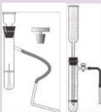
Рис. 7. Прибор для получения и собирания газов

Прибор для получения газов используется для получения небольших количеств газов: водорода, кислорода (из пероксида водорода), углекислого газа.