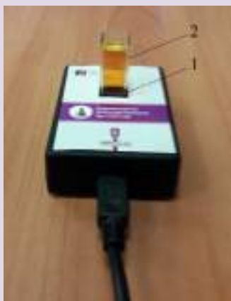
Рис. 1. Датчик оптической плотности: 1 — гнездо для кюветы; 2 — кювета для исследуемого вещества

Датчик температуры платиновый — простой и надёжный датчик, предназначен для измерения температуры в водных растворах и в газовых средах. Имеет различный диапазон измерений от -40 до +180 °С. Технические характеристики датчика указаны в инструкции по эксплуатации.