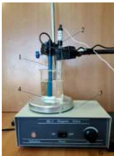
Рис. 2. Установка для определения концентрации (активности) хлорид-ионов в растворе. А: 1 — корпус датчика для определения \text{Cl}^- -ионов; 2 — разъём Micro USB для подключения к компьютеру; 3 — разъём BNC для подключения рабочего электрода; 4 — разъём для подключения электрода сравнения. Б: 1 — ионоселективный электрод (рабочий электрод); 2 — электрод сравнения (хлорсеребряный электрод); 3 — магнитная мешалка; 4 — якорь магнитной мешалки

Запрещается трогать мембрану электрода пальцами и приводить её в соприкосновение с твёрдыми поверхностями. При хранении ИСЭ чувствительная часть датчика (мембрана) должна быть защищена специальным колпачком. Не допускается использовать электроды с полимерной мембраной в средах, содержащих летучие вещества или органические растворители. Не следует использовать ИСЭ в сильных окислителях. Длитель-