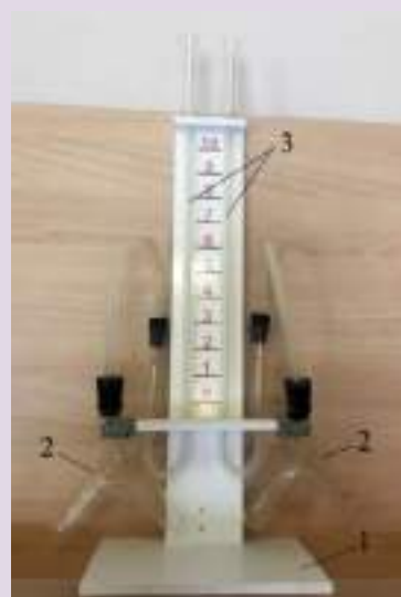
Рис. 4. Прибор для демонстрации зависимости скорости химических реакций от различных факторов: 1 — подставка; 2 — сосуды Ландольта; 3 — манометрические трубки

Прибор состоит из подставки, на которой закреплены две манометрические трубки, которые соединяются с сосудами Ландольта с помощью пластиковой трубки с пробками (рис. 5). Между манометрическими трубками на панели нанесена шкала для наблюдения уровня жидкости в трубках. Окрашенной жидкостью может быть раствор любого красителя в воде.