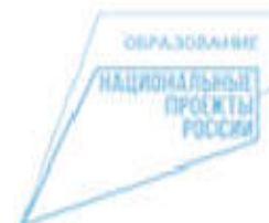
ГРАФИК РАБОТЫ ЦЕНТРА ОБРАЗОВАНИЯ «ТОЧКА РОСТА» на базе МБОУ «Маралихинская СОШ» на 2024-2025 учебный год

Рабочие дни: 5-ти дневка (понедельник-пятница)